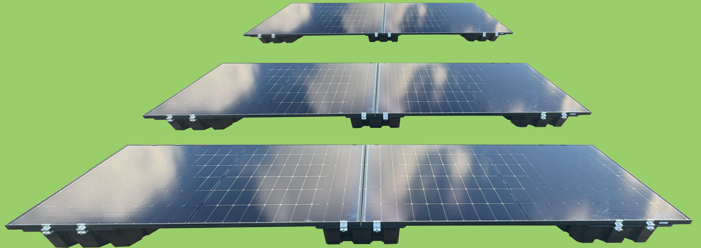
Schéma Fixations Bac à lester