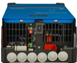
MultiPlus 2 000 VA (protection du bas retirée)