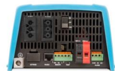
MultiPlus 500 / 800 / 1 200 / 1 600 VA